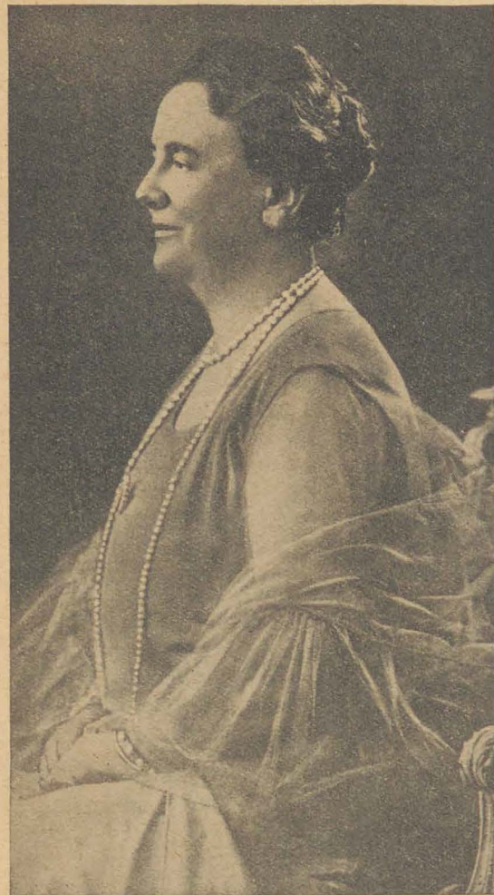
H. M. KONINGIN WILHELMINA.

Gedenkend aan eigen leed en nooden, willen wij ook den nood van andere natiën, die met ons door de tunnel gaan, voor den troon van God gedenken, want „wij zijn allen broeders in Christus Jezus, onzen Heer!”